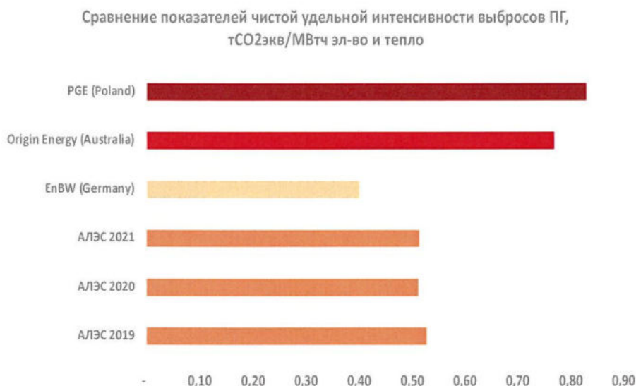
РИСУНОК 1 СРАВНЕНИЕ УДЕЛЬНЫХ КОЭФФИЦИЕНТОВ ВЫБРОСОВ ПГ ДЛЯ РАЗЛИЧНЫХ ЭНЕРГЕТИЧЕСКИХ КОМПАНИЙ

Предложенный Компанией в качестве КПЭ показатель можно оценить как важный, актуальный и имеющий стратегическую значимость с позиций развития отрасли. Морально и физически устаревшие генерирующие мощности уже не могут полностью стабильно, качественно удовлетворять растущие потребности потребителей. Сжигание угля в густонаселенном городе также негативно влияет на качество воздуха в г. Алматы. Планируемая реконструкция трех ТЭЦ и их перевод на газ позволит решить эти проблемы, значительно улучшив как экономические, так и экологические показатели АО «АлЭС».